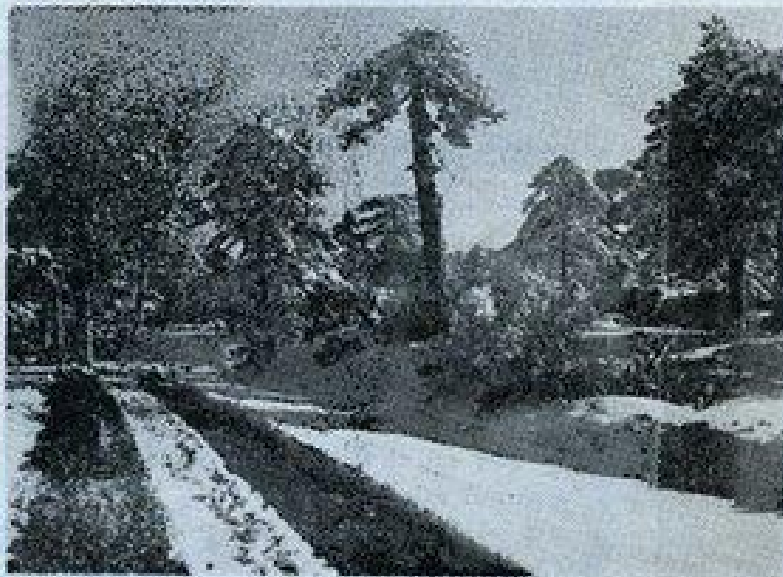
Στό χιονισμένο Τρόδος (της Χρυσάνθης Ζιτσαίας)

ΜΗΝΙΑΙΑ ΤΟΥΡΙΣΤΙΚΗ ΕΠΙΘΕΩΡΗΣΙΣ - ΕΚΔΟΣΙΣ: Γ.ΤΑΚΗΣ ΣΟΛΩΜΩΝΙΔΗΣ ΑΤΑ. ΦΙΛΑΔΕΛΛΗΝΩΝ 4-ΑΘΗΝΑΙ (118) ΤΗΛ.: 3233.176)7 ΜΑΡΤΙΟΣ 1973 ΑΡ. ΤΕΥΧΟΥΣ 41