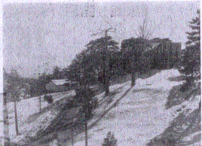
* Τὸ Τρόδος, τὸ πικρὸ φηλό βουνὸ τῆς Κύπρου, τὸν χειμῶνα μαζεὺται χιόνι, καὶ σκίερ ἀπ' ὅλο τὸν κόσμον. Εἶναι διεθνὲς κέντρον χιονοδρομίας. Ἡ Κύπρος ἔχει τουρισμὸν ὅλο τὸ χρόνο...

Ἐν τῷ μεταξύ — σήμερον — οἱ Κύπριοι δημοσιογράφοι καὶ πράκτορες — οἱ ὅποιοι φιλοξενοῦνται ὑπὸ τῆς Νομαρχίας Λαδοκανήσου θὰ παρακολουθήσουν τὸς ΝΧΟΣ ΚΑΙ ΦΩΣ. Μήπως θὰ πρέπει ὁ κ. Σολομωνίδης, νὰ σκαρθῆ νὰ θὰ παρακολουθήσουν τὸ ΝΧΟΣ