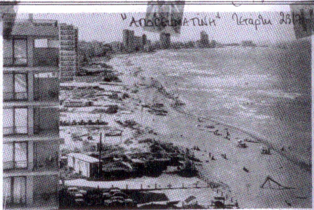
ΑΠΟΡΡΕΥΜΑΤΩΝ Κατάρτι 23/7

ΣΤΗΝ ΕΙΣΤΑΛΙΑΚΗ ΚΥΠΡΟ: Η «ΧΡΥΣΗ ΑΜΜΟΧΩΣΤΑ» ΤΗΣ ΑΜΜΟΧΩΣΤΟΥ