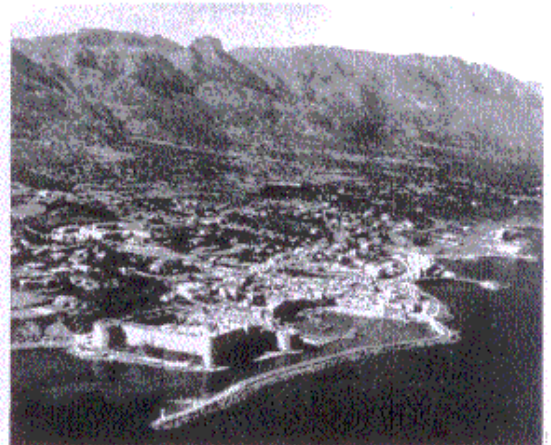
Άνω: μιὰ άποψις τής Κυρηνείας. Κάτω: Άνάσπληρωμένο άρχαίο θέατρο, στόν κόλπο τού Μόρφου.