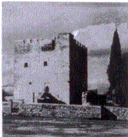
Ό Πύργος Καλοσσίου παρά τή Λεμεσό.