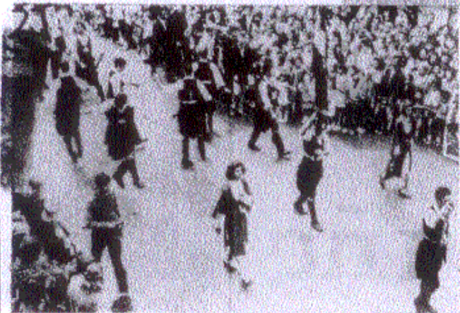
Το χειμερινό συγκρότημα της Λεμεσού.