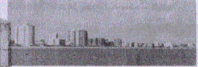
* Η Αμμόχωστος με τήν Χρυσή Άμμοδιά τής, τούς 14ορούς ούρανούσους και τήν μεγάλην τερροστικήν κηρήν.

Η φύσις και οι άνθραπος, έπροίκισαν τά δύο νησιά μας με άφθαινα τουριστικά προσήματα. Έν τούτοις, αι κα:αβληθείσαι από τής συστήσεως τής Κυπριακής Δημοκρατίας προσπάθειαι, διά τήν δαλίωσην και άνάπτυξιν των τουριστικών συνθηκών τής Κύπρου, δέν ήσαν άνάλογοι των δραστηριοτήτων άλλων χωρών συναγωνιστικών του χρόπου μας εις τήν τουριστικόν τομέα. Μέχρι και τού 1966 τά μεγέθη των τουριστικών αριθμών εις Κύπρον, έκινήθησαν εις λίαν χαμηλά επίπεδα. Η καυστέρισίς μας, τότε, περί τήν τουριστικήν αξιοποίησιν πρέπει να άποθού εις έξωγενείς παράγοντας. Τό πολεμικόν κλίμα που έπικράτει, ένεφάνιζε τήν Κύπρον, μεαξυ του διεθνούς τουριστικού κοινού, ως ήφαίστειον έν συνεχή δράσει. Από τού 1966 όμως τράπρη γρηστα ήρχισαν ν' αλλοιάσων. Και τού 1968 έμφανίστην 88.471 τουρίστας στήν Κύπρον, για πολυμε-